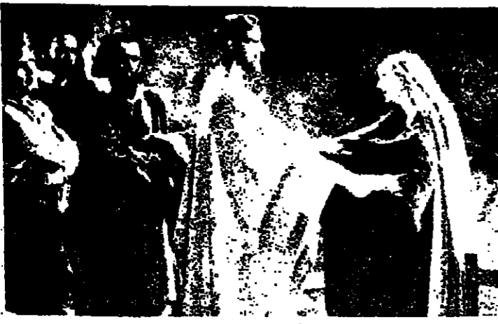
لقطة من فيلم «ملك الملوك» الذي أخرجه دي جيل عام 1977